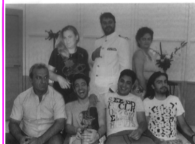
“Ο Στρίγκλος που έγινε αρνάκι”

ΘΕΑΤΡΙΚΟ ΕΡΓΑΣΤΗΡΙΟ ΣΠΕΡΧΕΙΑΔΑΣ-ΜΑΚΡΑΚΩΜΗΣ ΚΕΝΤΡΙΚΗ - ΝΕΑ ΣΚΗΝΗ